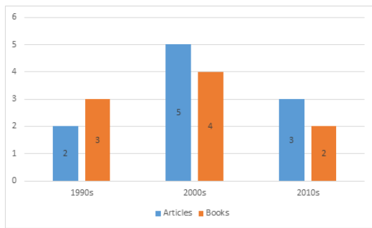
Fig. 2. Classification by Year

여드름의 예방 및 관리 방법에 대한 문헌 19개를 출판연도별로 분석하였다. 1990년대에 출판된 문헌은 논문 2편, 도서 3편, 총 5편(26.3%)으로 나타났다. 2000년대에 출판된 문헌은 논문 5편, 도서 4편, 총 9편(47.3%)으로 나타났으며, 2010년대에 출판된 문헌은 논문 3편, 도서 2편, 총 5편(26.3%)으로 나타났다. 분석 결과는 아래 표로 정리하였다(Fig. 2).